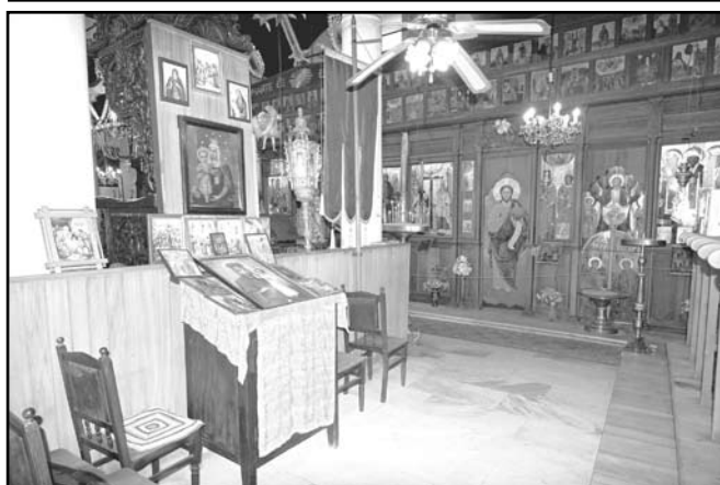
Продължение от стр. 1

Няколко групи лазарки ще посетят и Община Созопол, за да поздравят служителите ѝ.