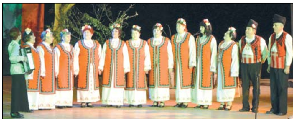
Красивите тракийски песни, изпълнени от созополските тракийци, разчувстваха зрителите в ивайловградското читалище

Празникът бе отбелязан с красив концерт, организиран от ТД „Яни Попов“ съвместно с община Созопол и община Ивайловград. Концертът-спектакъл на созополските тракийци остави без дъх изпълнената зала на ивайловградското читалище. Зрителите останаха задълго онемели от сцената, която представя нерадостната съдба на тракийците и издевателствата на озверелите турци върху тях.