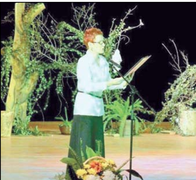
Концертът-спектакъл на ТД „Яни Попов“ представи по неповторим начин трагедията на тракийските бежанци