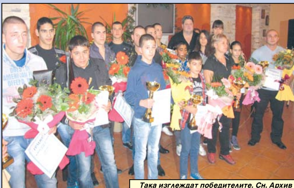
Така изглеждат победителите.

Балът на спортиста ще събере спортния елит за награждаването на най-успешните състезатели на общинските клубове