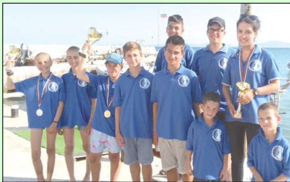
Ветроходците, които прославиха Созопол

СНЦ "Общински яхтклуб СОЗОПОЛ" изпраща 2015 година с много успехи