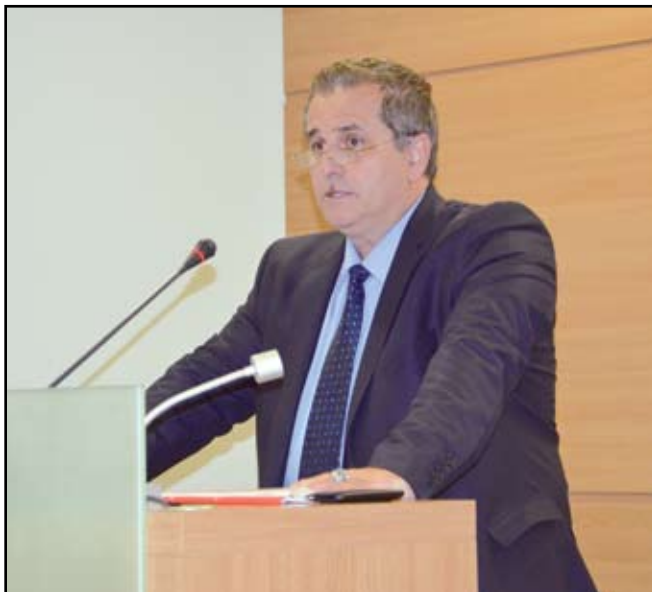
Кметът Панайот Рейзи представя Проекта за БЮДЖЕТ НА ОБЩИНА Созопол за 2016 г.

Кметът Панайот Рейзи запозна присъстващите с Проекта за бюджет на Община Созопол за 2016 година, изготвен от Общинска администрация.