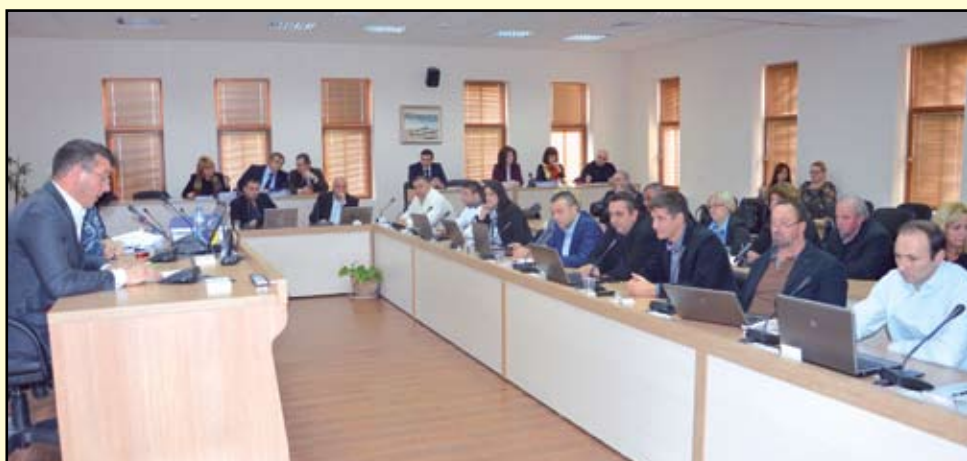
Общински съветници бяха избрани за членове на различни комисии по действащите наредби на Община Созопол

Общинският съвет гласува първото проектно предложение от новия мандат