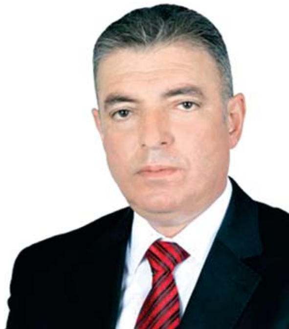
УВАЖАЕМИ ЖИТЕЛИ НА ГРАД ЧЕРНОМОРЕЦ, СКЪПИ СЪГРАЖДАНИ,

Поздравявам ви с празника на град Черноморец и ви пожелавам здраве, сила и вяра, за да работим за добруването на нашия прекрасен град и за неговото развитие!