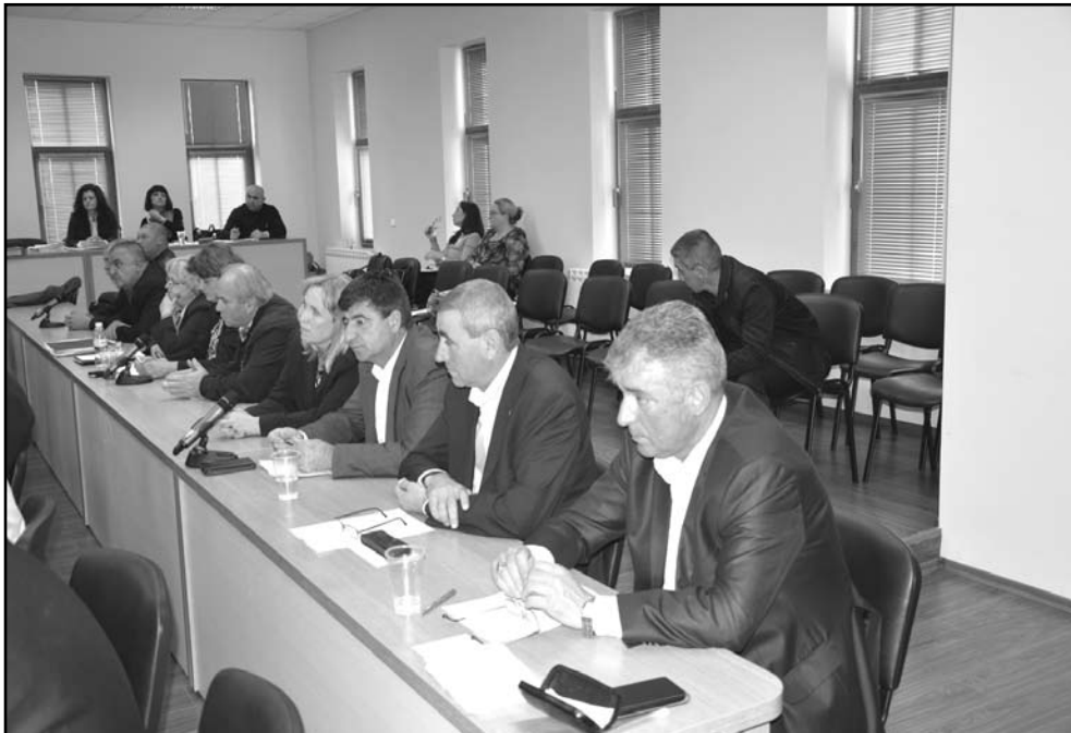
Кметове и кметски заместници присъстват на всяка сесия на Общинския съвет и имат възможност да поставят проблеми за решаване и въпроси към Общинския съвет