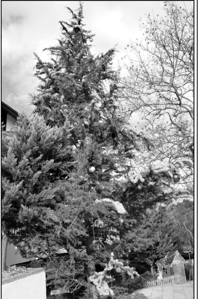
Елхата пред сградата на Община Созопол очаква малки и големи за старта на Коледно-новогодишните празници.

Вечерта ще продължи с пищен концерт, организиран от НЧ „Отец Паисий“, посветен на Никулден. В празничния концерт ще участват: фол-